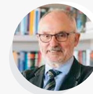
19:50h Sr. RAFAEL RIBÓ Síndic de Greuges de Catalunya